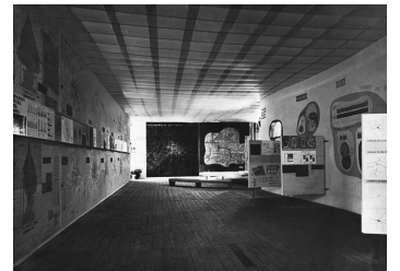
FOTO: © AKADEMIE DER KÜNSTE, BERLIN, HANS-SCHAROUN-ARCHIV, NR. 3781 F. 162/1

EINE AUSSTELLUNG ZUM 80-JÄHRIGEN JUBILÄUM DES STADTENTWICKLUNGSPLANS „KOLLEKTIVPLAN“ > ERÖFFNUNG: 5.6.2026, 19 UHR 20.6.2016, 13–20:30 UHR, SYMPOSIUM IM SILENT GREEN (KUPPELHALLE), GERICHTSTRASSE 35, 13347 BERLIN, OHNE ANMELDUNG 6.6.–2.8.2026