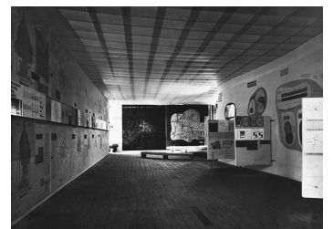
FOTO: © AKADEMIE DER KUNSTE, BERLIN, HANS-SCHAROUNARCHIV, NR. 3781 F. 192/1

EINE AUSSTELLUNG ZUM 80-JÄHRIGEN JUBILÄUM DES STADTENTWICKLUNGSPLANS „KOLLEKTIVPLAN“ BIS 2.8.2026